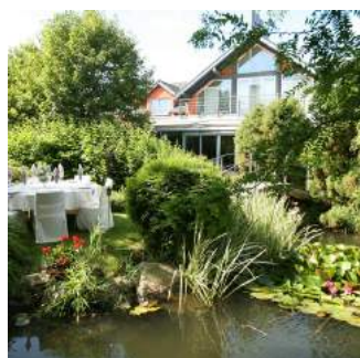
Piękny o każdej porze ogród