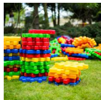
Atrakcje dla dzieci