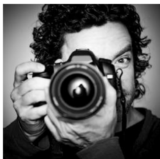
SESJĘ FOTOGRAFICZNA 50 zdjęć / 600zł