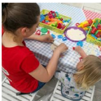
ANIMATORA DLA DZIECI 250zł / 1h