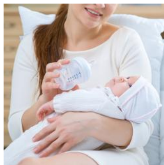
MIEJSCE DLA MAMY KARMIĄCEJ