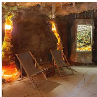
GROTĘ Z TĘŻNIĄ SOLANKOWĄ W OGRODZIE