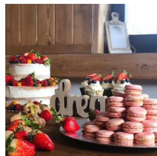
SŁODKI STÓŁ 40ZŁ / OS

REZERWACJE NA PRZYJĘCIA PRZYJMujemy OD 20 OSÓB