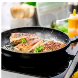
WSZYSTKIE RODZAJE DIET