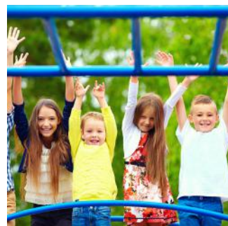
PLACA ZABAW DLA DZIECI