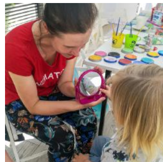
Atrakcje dla dzieci

MASZ PYTANIA? SKONTAKTUJ SIĘ Z DZIAŁEM SPRZEDAŻY: