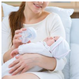
Miejsce dla mamy z dzieckiem