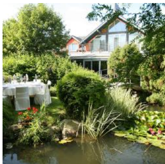
Piękny o każdej porze ogród