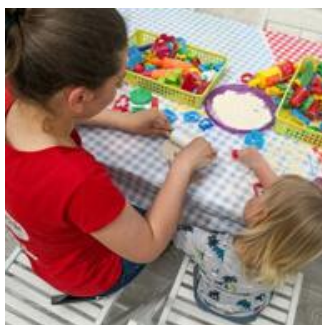
ANIMATORA DLA DZIECI 300zł / 1h