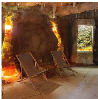
GROTĘ Z TĘŻNIĄ SOLANKOWĄ W OGRODZIE