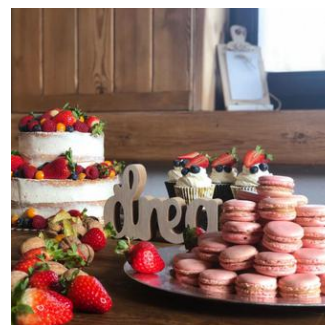
SŁODKI STÓŁ 40ZŁ / OS

REZERWACJE NA PRZYJĘCIA PRZYJMujemy OD 20 OSÓB