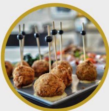
RILLETES Z KACZKI